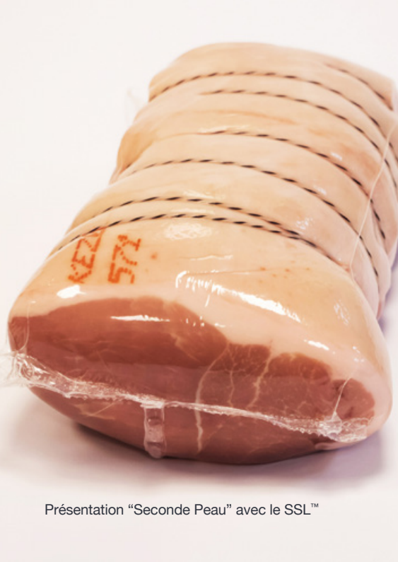
Présentation "Seconde Peau" avec le SSL™